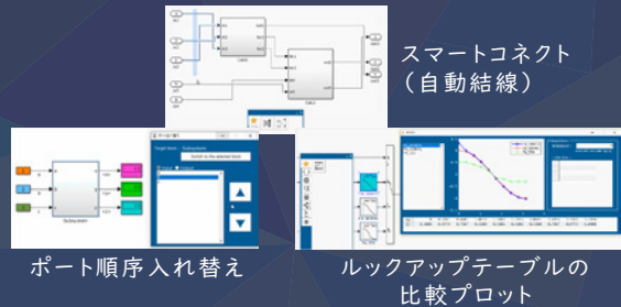
スマートコネクト (自動結線)